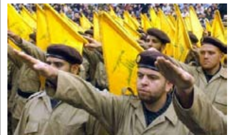
Foto: Radikale Muslime der palästinensischen Hisbollah zeigen den bei ihnen sehr populären „Hitler-Gruß“.